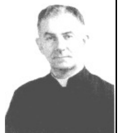
Don Vittorio Gardini

Quando gli fu spiegato che, in termini tecnici, "botte" stava a significare un canale passante sotto l'Idice, per portare le acque della Zena in Reno, il Papa pronunciò una frase rimasta famosa: "Con tutto quello che mi è costato potevate farmela d'oro questa...Botte.